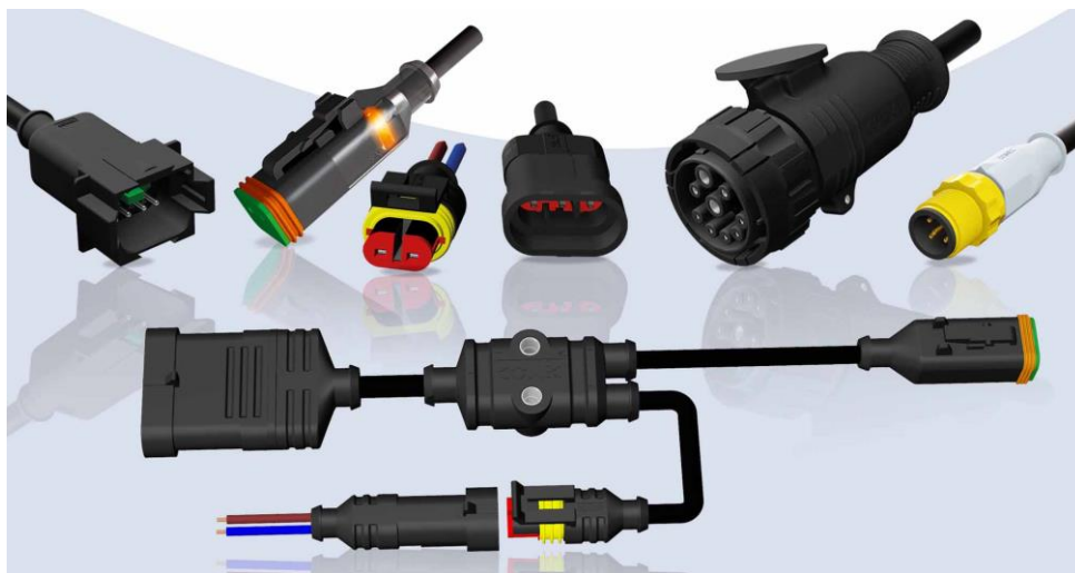
Kép: DT széria, VSS-Superseal széria, ISOBUS, M12x1öntött és S, M, L-típusú elosztó csatlakozók

Legyen szó traktorokról, földmunkagépről vagy nehéz építőipari gépjárművekről, az IVCM ipar (Industrial Vehicles and Construction Machines) magas követelményeket támaszt a felhasznált csatlakozókkal szemben. A CONEC által kifejlesztett DT- és VSS-Superseal öntött dugaszoló csatlakozócsalád optimális védelmet nyújt a legmostohább körülmények között is, mint pl. bányákban, fagypont alatti vagy poros, forró környezetben. A DT és VSS-Superseal szelep csatlakozócsalád tagjai „kábel a kábelcsatlakozóhoz” elv szerint kerülnek alkalmazásra és egy karmantyú révén biztos kötést képeznek az ellenoldali csatlakozóval. A CONEC-féle fröccsöntéssel a dugaszolt csatlakozópár egész hosszában teljesíti az IP67/IP69K környezeti előírásokat. Opcionálisan kapható még a DT csatlakozócsaládon belül egy olyan változat is, amely LED-es állapotjelző fénnel van felszerelve, amely 360 fokban világít. A rendszer védőáramköre a kapcsoló- és zavarófeszültségeket távol tartja magától a LED-től és az egyéb csatlakoztatott áramköröktől is.